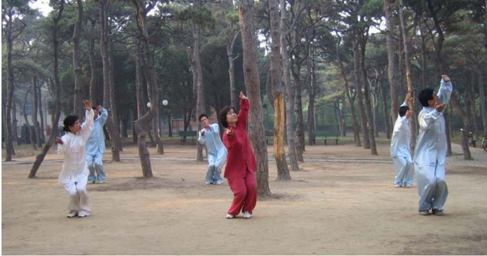
Prácticas de Qi Gong en el Hospital de Qi Gong de Bei Dai He, China