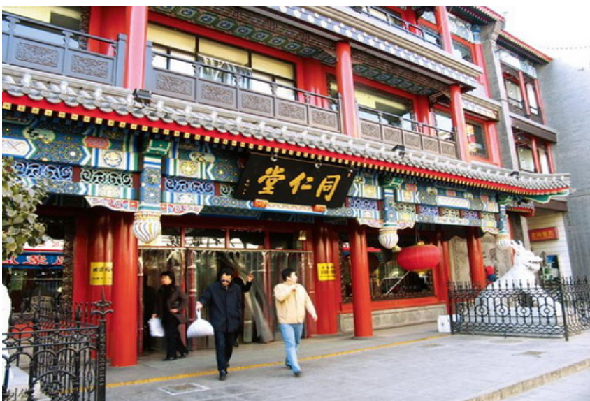
Tong Ren Tang, Farmacia de hierbas chinas más importantes de China, Beijing.