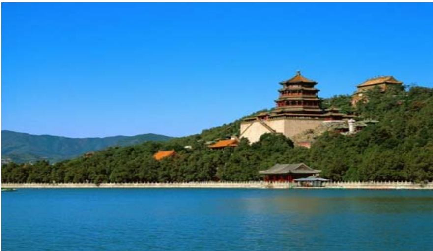
Palacio de Verano, Beijing.

Tel: 93 140 1120, 666 621 157, Email: mtcbarcelona@yahoo.es