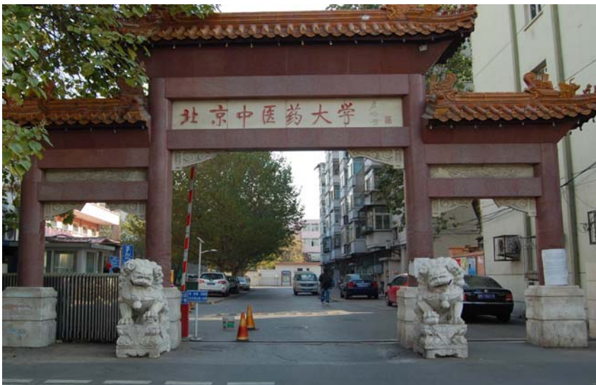
Universidad de Medicina China de Beijing, China.