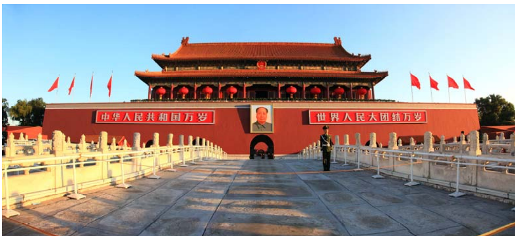
Pl. Tian An Men y Ciudad Prohibida, Beijing.